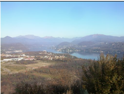
Panorama dalla Madonna della Guardia

Si sale poi alla cappella della Madonna della Guardia (mt 541).