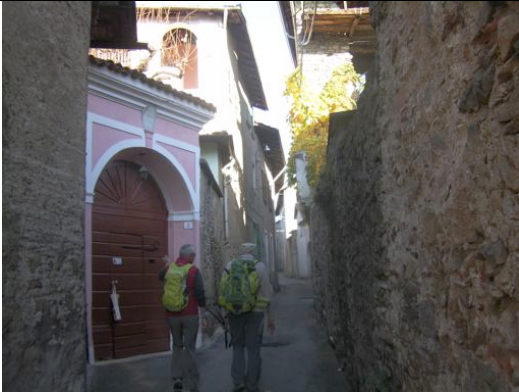
Auzate strada per Bugnate

Si risale poi percorrendo un sentiero sterrato verso Auzate, ove è possibile ristorarsi presso il locale circolo Fratellanza.