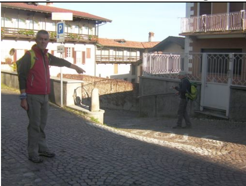
Deviazione a Soriso per valle della Grua

Quindi, seguendo la strada asfaltata si arriva a Piovino e quindi a Gargallo (oratorio di S. Rocco), da cui si prosegue verso Soriso.