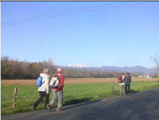
Da Vergano verso Piovino - Gargallo

Partendo dall'Oratorio di Borgomanero, si passa a fianco del collegio dei Salesiani, si procede per la frazione di S. Stefano e poi per Vergano - Castello.