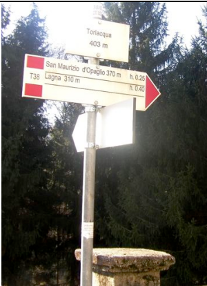
Pugno - Berzonno - Torlacqua

Da Torlacqua parte un percorso segnalato in direzione Lagna.