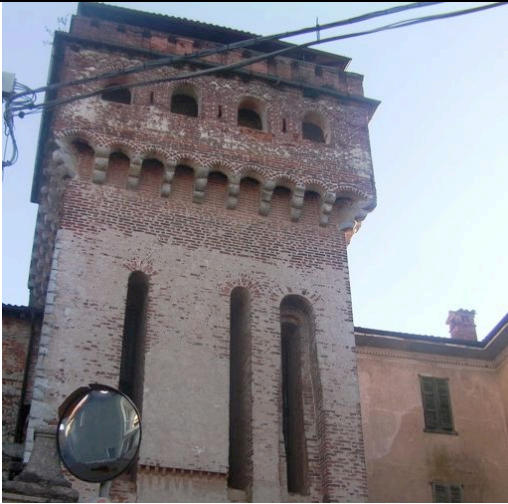
Castello di Vergano

Partendo dall'Oratorio di Borgomanero, si passa a fianco del collegio dei Salesiani, si procede per la frazione di S. Stefano e poi per Vergano - Castello.