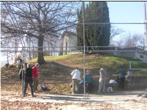
Madonna della Guardia

Da Auzate si imbecca la strada asfaltata per Bugnate.