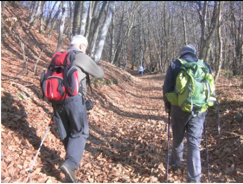
Piana dei monti - Passo Cambocciolo

Proseguendo sempre sul percorso "Le valli della fede" una comoda mulattiera in salita, con qualche tratto un po' ripido, porta al passo Cambocciolo