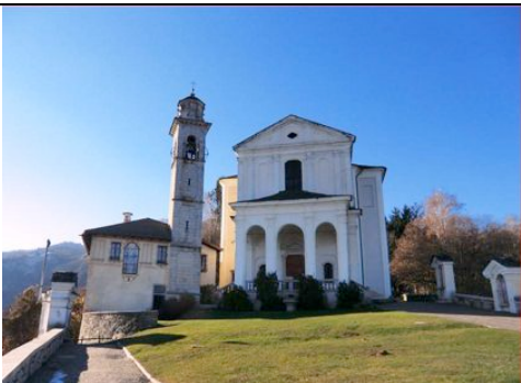
Santuario Madonna del Sasso

Si seguono quindi le indicazioni per il santuario della Madonna del Sasso costruito in stile barocco nel 1771, che merita una sosta e una visita.