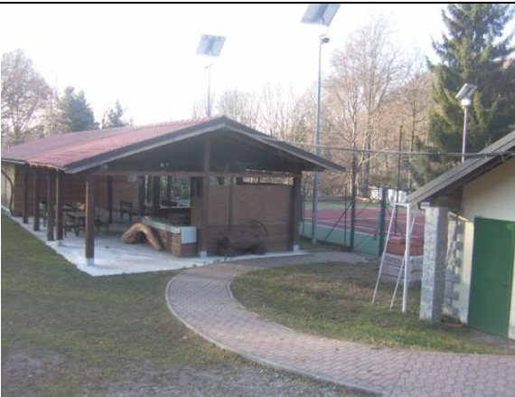
S. Bernardo, area attrezzata