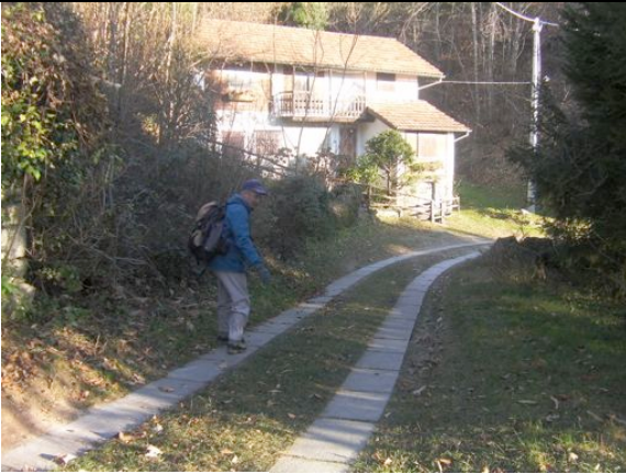
S. Bernardo - Breia

Si parte da S. Bernardo di Breia -piccola chiesa dedicata al Santo, che proteggeva i viandanti che attraversavano il) valico.