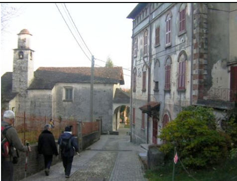
Chiesa di Artò

Si imbecca quindi una scorciatoia che porta a Centonara.