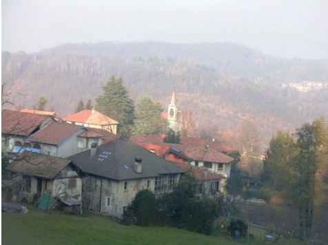
Panorama da Madonna del Sasso

Dal santuario si percorre su strada asfaltata il tratto per Artò.