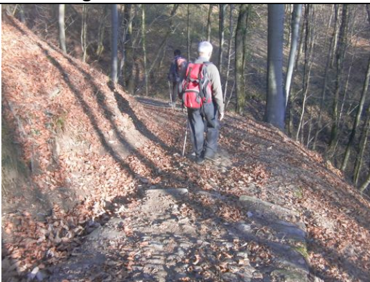
Cadarafagno - Piana dei monti

Breve tratto di strada asfaltata per raggiungere Cadarafagno.