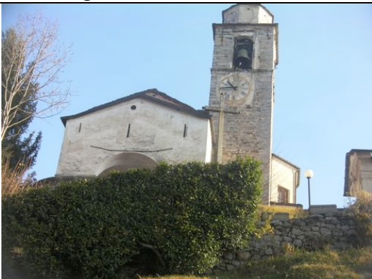
Piana dei monti - chiesa

A Cadarafagno seguire le indicazioni "Le valli della fede" che conducono per uno stretto sentiero nel bosco. Il sentiero, inizialmente in discesa e poi in ripida salita, porta alla località Piana dei monti.